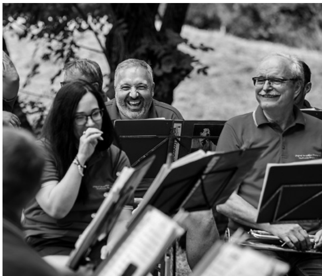
Musiker*innen aus dem Musikantenlanddorf Brücken spielen auf dem Fest „Kultur unter'm Nussbaum“.