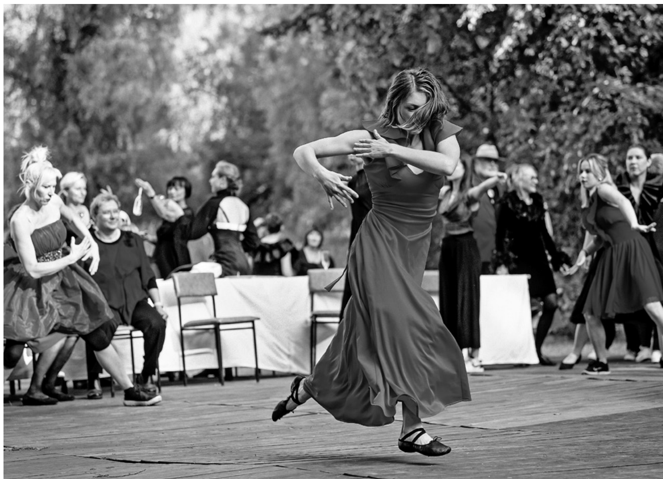
Vor fast 1000 Gästen tanzen die Beteiligten von „Das Fest – Tanz auf dem Plateau“ im Park der Kapelle Battinsthal.

Dass durch die Dorfesidenzen neue Synergien in den Orten selbst und über Ortsgrenzen hinaus entstehen können, haben bereits einige der bislang acht initiierten Dorfesidenzen gezeigt. „Der Prozess ist die Kraft“, fasst Wiebke Waburg zusam-