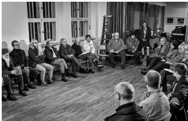
Bei einem Treffen im Ort Hintersee diskutiert das Kulturlandnetzwerk über die Zukunft von Heimatstuben in der Region Uecker-Randow.

TRAFÖ-Region Uecker-Randow www.kulturlandbuero.de/angebote/kulturlandnetzwerk