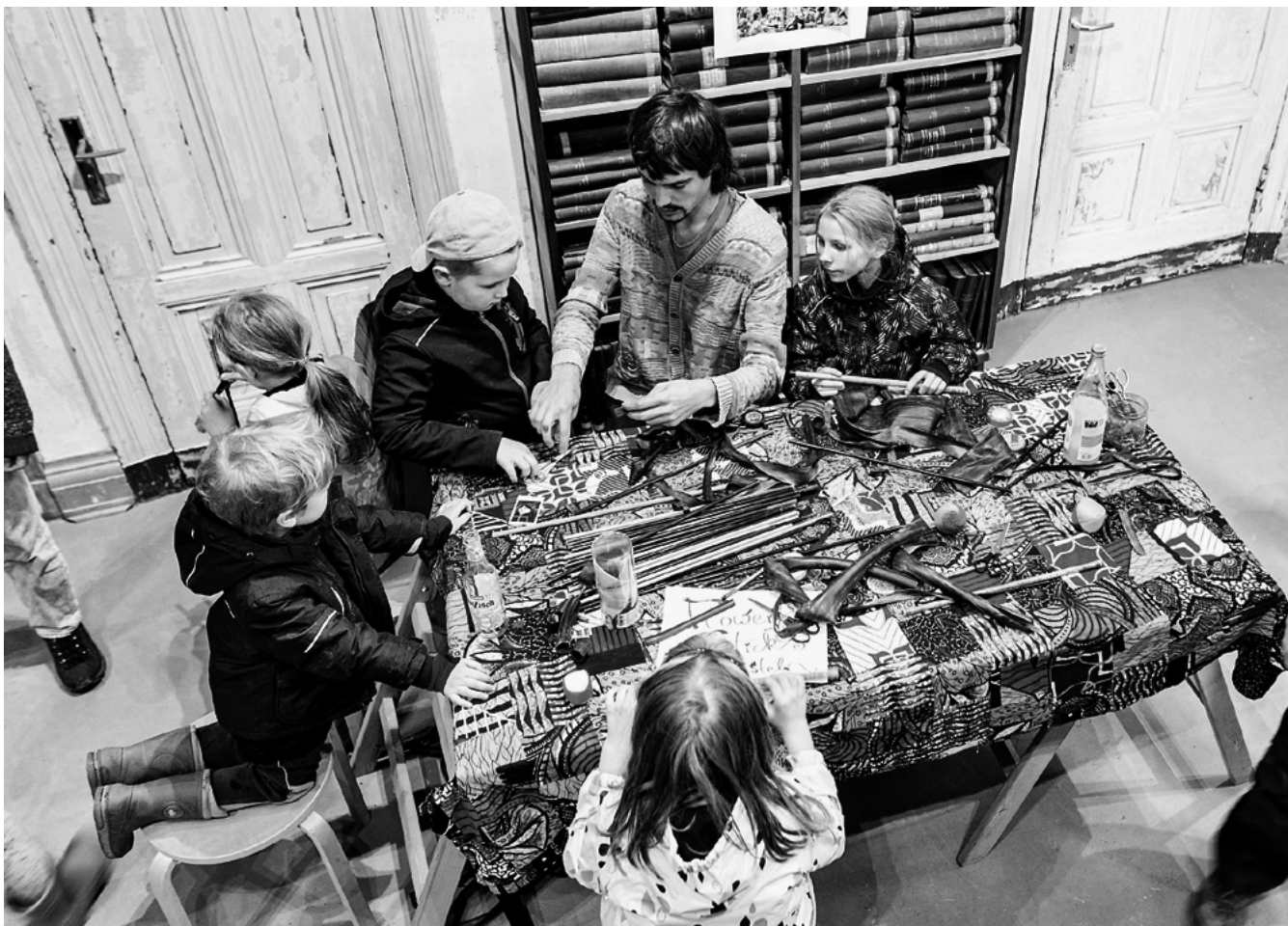
Kinder und Jugendliche nehmen an einem Workshop im Rahmen des Jahresthemas „Jugend“ teil.