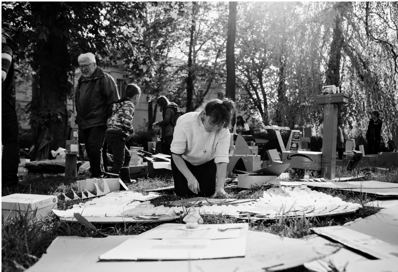
Das Schlossfest #Blickwechsel wird jährlich von Köthener Bürger*innen, kulturellen Initiativen und Vereinen organisiert.

Der Schlossbund selbst ist offen für alle Bürger*innen der Stadt Köthen (Anhalt) und des Landkreises Anhalt-Bitterfeld. Ins Leben gerufen hat den Bund die Kulturinitiative „Köthen 17_23“ und als Träger fungiert die im Schloss ansässige Köthener BachGesellschaft. Ein hauptamtlich betreutes Projektbüro, das derzeit mit vier Projektstellen besetzt und einer weiteren Personalstelle der Stadt Köthen (Anhalt) unterstützt wird, koordiniert alle Aktivitäten und dient als erster Anlaufpunkt für alle Akteur*innen.