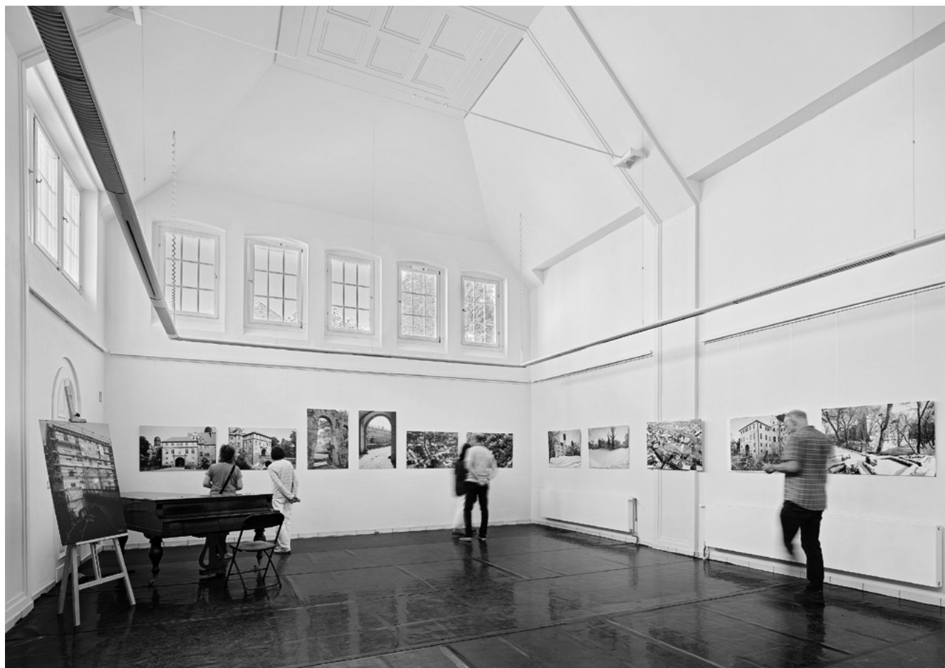
Ein Haus für die Zivilgesellschaft: Mit der Wiederbelebung des Dürerbundhauses ist ein offener Raum für Vereine und Initiativen entstanden.