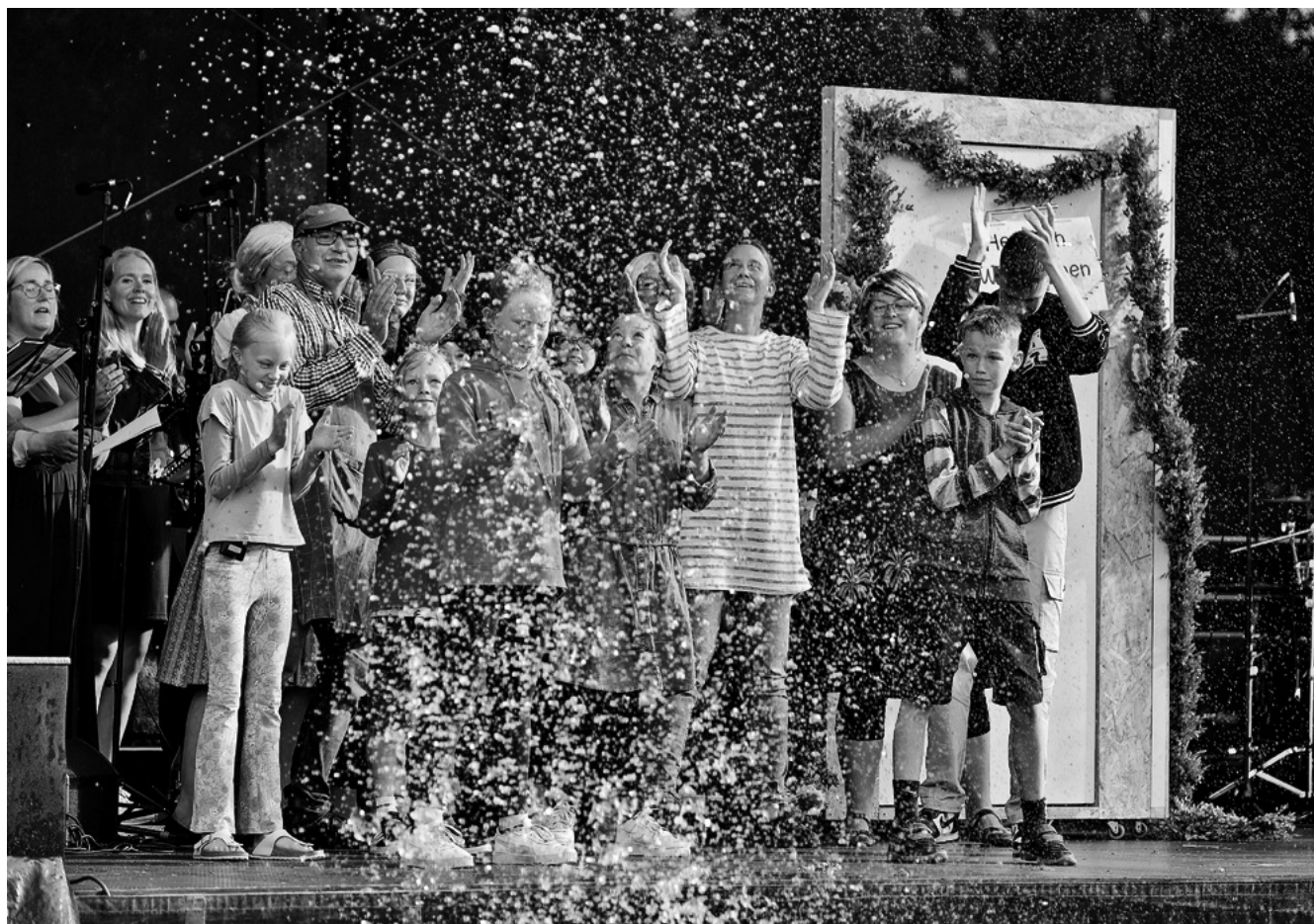
In Bargstedt schreiben und inszenieren Bewohner*innen unterstützt durch KreisKultur ein eigenes Dorfmusical.

Mal findet das Pop-Up-Café in einer Scheune statt, mal auf dem Dorfplatz oder in einem ehemaligen Kindergarten. Los geht's mit einem Bulli voller Kreativmaterial. Mit Hilfe von Playmobilfiguren können Bewohner*innen beispielsweise auf einer groß ausgedruckten Karte des Ortes Dorfsituationen spielerisch nachstellen, ihren Ort erklären. Kinder zeigen, wo sie am liebsten spielen, Bürger*innen, wo Wege verlaufen. Die einen nutzen die Playmobilfiguren, andere kneten etwas, wieder andere erzählen von ihrem Ort bzw. auch davon, was sie vermissen. „Es wird deutlich, wie der Ort tickt“, so Stefanie Kruse. „Leerstellen zeigen sich,