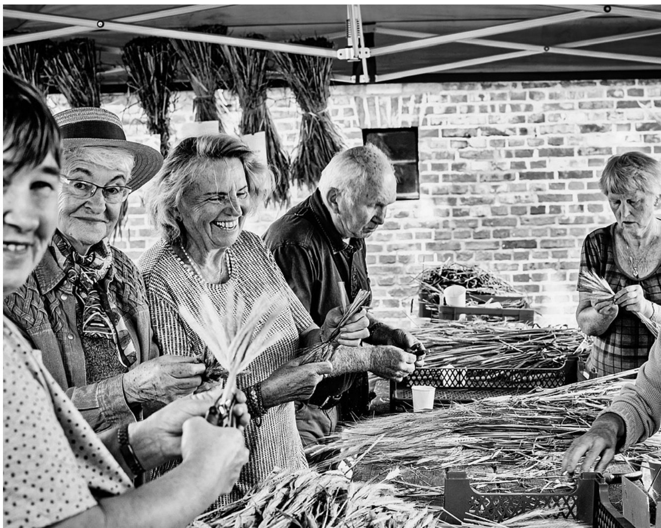
Auf dem Programmtag „Ährensache“ bindet der Altranfter Traditionsverein traditionelle und außergewöhnliche Erntekronen.