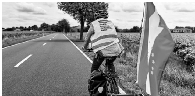
Die Kulturerbe-Orte im Oderbruch laden dazu ein, Geschichte und Gegenwart der Region zu entdecken.