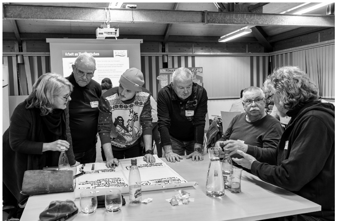
Im Rahmen eines Ideensalons im Altenburger Land diskutieren Einwohner*innen von Schmölln über die Zukunft ihres Ortes.

TRAFO-Region Altenburger Land www.fliegender-salon.de