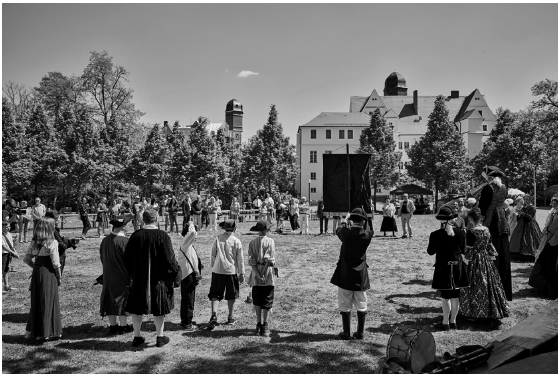
Der Köthener Schlossbund belebt seit 2020 das zentral gelegene Schlossareal und entwickelt es zu einem Ort bürgerschaftlichen Miteinanders.

Eine gemeinsame Sprache zu finden, Skepsis und Misstrauen ab- und Vertrauen aufzubauen und immer wieder neu zu bestätigen, sind essentieller und fortlaufender Bestandteil der Arbeit des Schlossbundes und seiner Mitglieder.