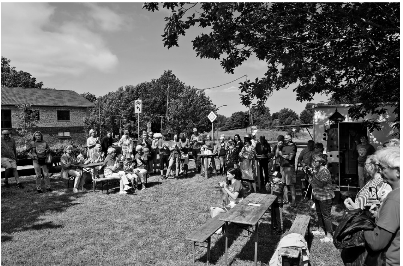
Im Rahmen der Aktion „Tempo Runter“ treffen sich Brekendorfer Bürger*innen, um mit kreativen Mitteln für eine Verkehrsberuhigung zu demonstrieren.

Die Bedingungen und Anforderungen für die Teilnahme sind einfach und auf der Website klar formuliert. Drei Punkte müssen erfüllt werden: „Der Ort liegt im Kreis Rendsburg-Eckernförde. Der Ort hat ein gelbes Ortsschild. Ihr möchtet, dass in Eurem Ort Kultur stattfindet und diese zu nachhaltiger Veränderung nutzen.“ Die Bewerbung kann jede*r aus dem Ort einreichen: „Es ist egal, ob ihr