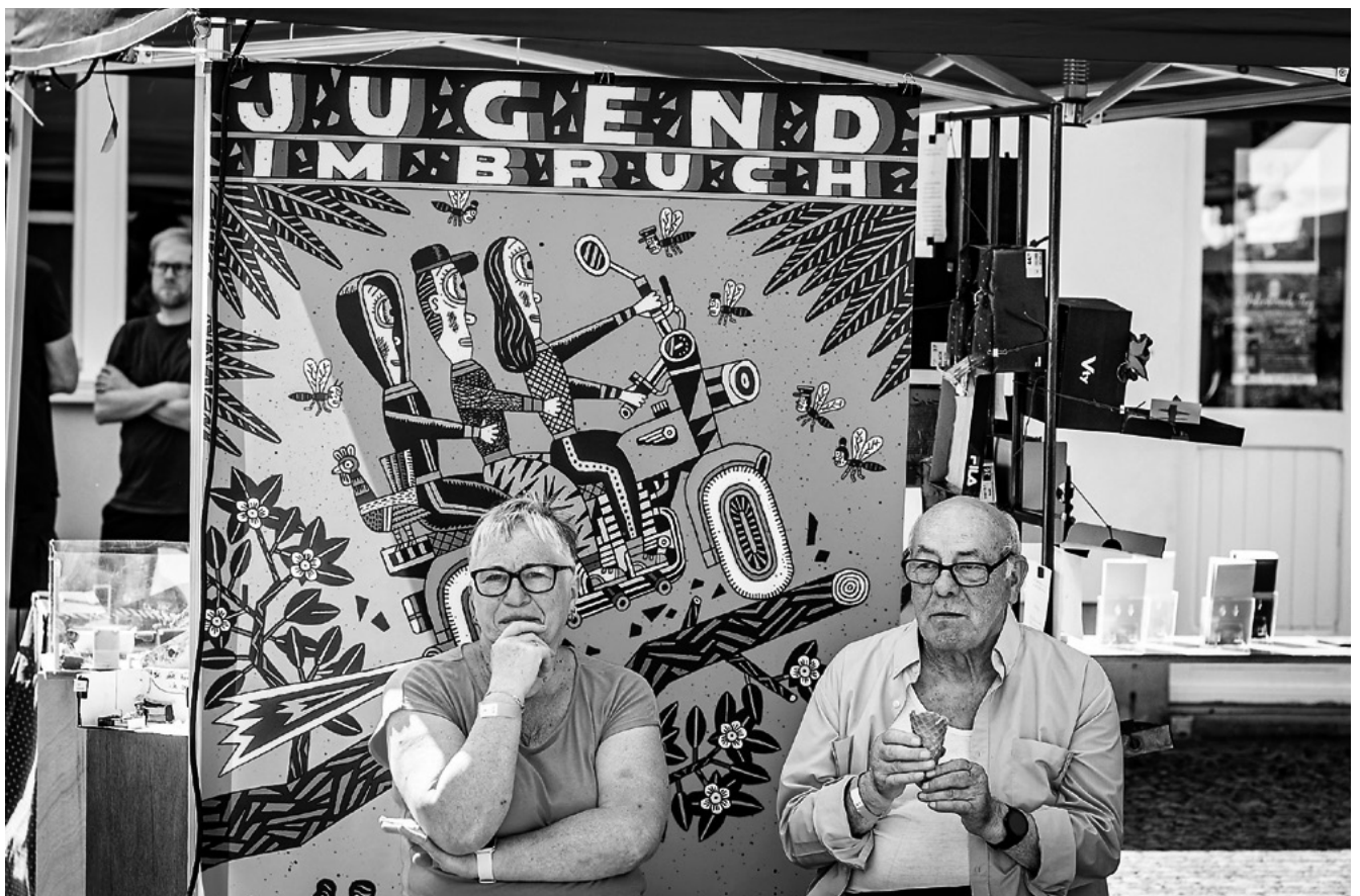
Bewohner*innen des Oderbruchs vor dem Plakat des Künstlers Hennig Wagenbreth. Das Motiv entwickelte der Künstler auf Basis von Gesprächen mit Jugendlichen aus der Region.

Durch die Gespräche entstehen kollektiv produzierte Fragestellungen für Ausstellungen, Filmprojekte, Theaterprojekte oder Bildungsformate. Das konkrete Programm erarbeitet das Museumsteam dann zu großen Teilen wieder gemeinsam mit Kooperationspartnern.