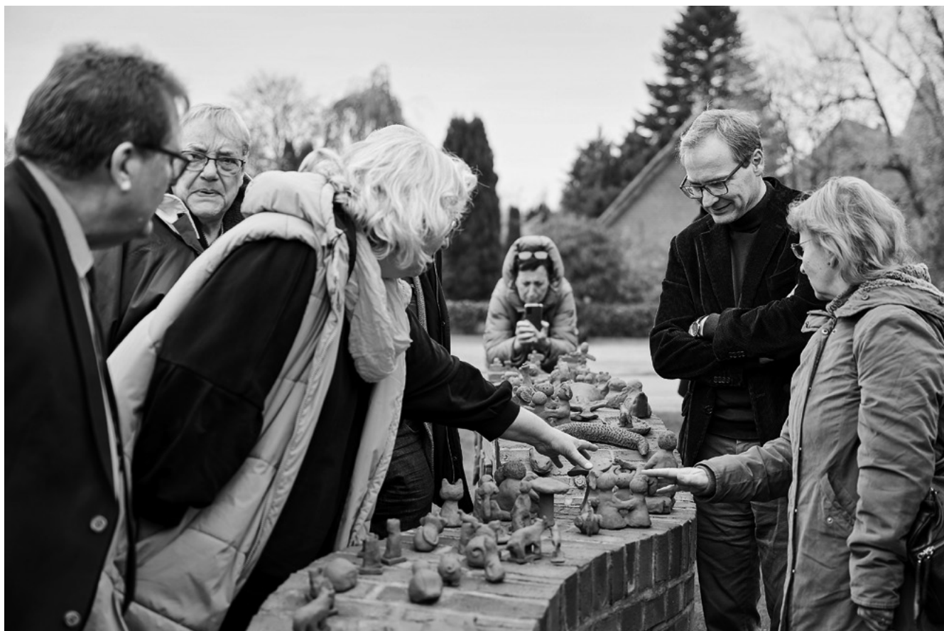
Mehr als 40 Familien wirken an der Dorfskulptur aus Tonfiguren im Ort Sehestedt mit.

Land, sondern vielmehr werden die kulturellen Angebote jeweils aus den Bedürfnissen und Bedarfen heraus gemeinsam mit den Menschen vor Ort entwickelt.