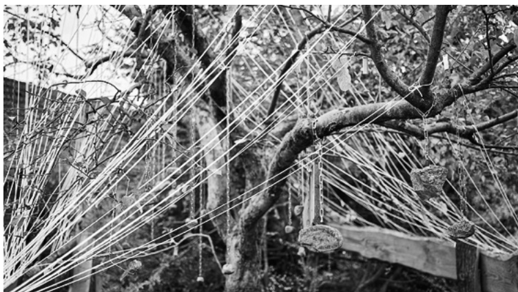
Die fünf Kulturinstitutionen von KreisKultur gehen im Konsortium neue Wege und bündeln ihre Ressourcen.

TRAFÖ-Region Rendsburg-Eckernförde www.kreiskultur.org