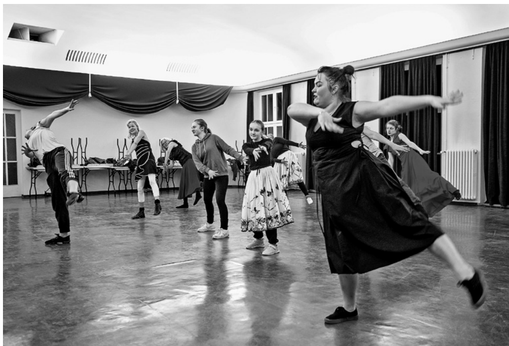
Tänzer*innen proben in der Regionalen Schule Penkun für die Aufführung von „Das Fest – Tanz auf dem Plateau“ in Battinstahl.