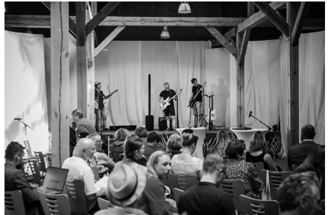
Gäste des Fachtags Kultur besuchen ein Konzert in der Kulturscheune Rothenklempenow.