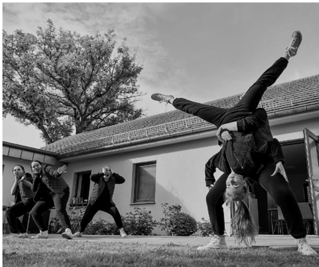
Bei der Kulturlandschau in Mönkebude steht der Austausch zwischen jungen und alten Menschen im Mittelpunkt.