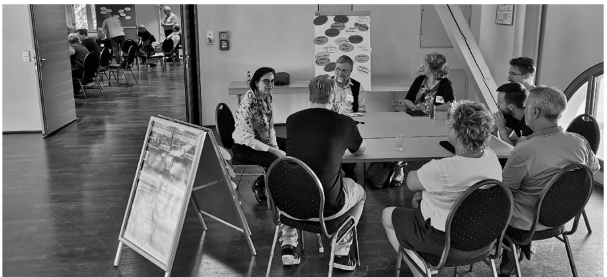
Die Projektgruppen des Schlossbundes entwickeln Ideen für die Nutzung des Köthener Schlossgeländes.