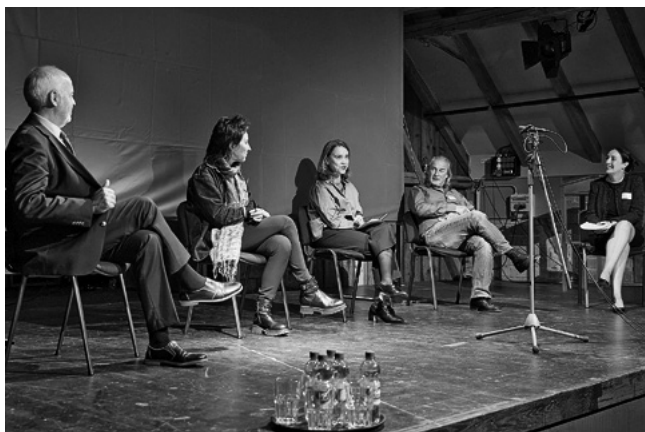
Kulturpolitisches Podium im Rahmen der Kulturplattform #5 der Lernenden Kulturregion Schwäbische Alb.

TRAFO-Region Uecker-Randow www.kulturlandbuero.de