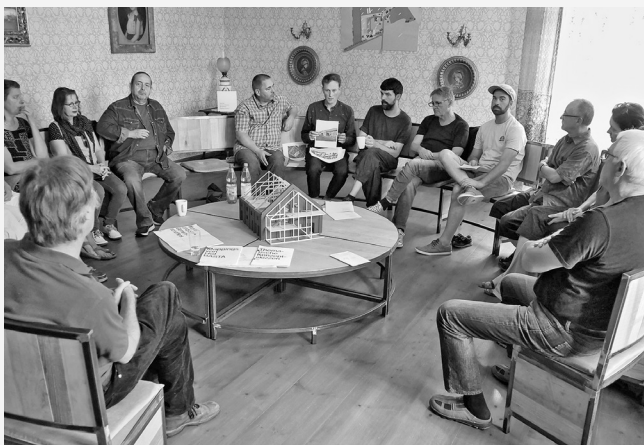
Diskussionen, die in die Ausstellung einfließen: Salongespräch des Oderbruch Museums Altranft zum Jahresthema Baukultur.

TRAFO-Region Oderbruch www.oderbruchmuseum.de/jahresthema