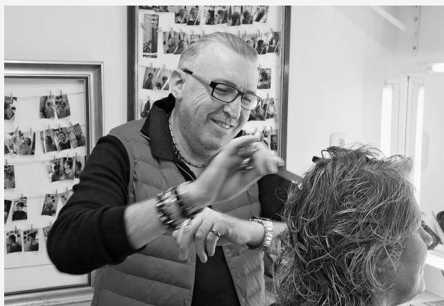
Haarschnitt in der Theatergarderobe: Einmal pro Woche wird das Theater Lindenhof zum Friseursalon.

Mitgestaltung als kuratorisches Prinzip: Besucher*innen des Oderbruch Museums werden nach ihrem Ausstellungsbesuch befragt.