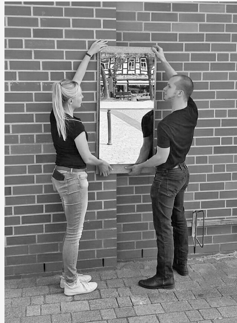
Blick von außen: Studierende der HAWK Hildesheim entwickeln Ideen für die Sichtbarkeit des Jacobson-Haus Seesen.