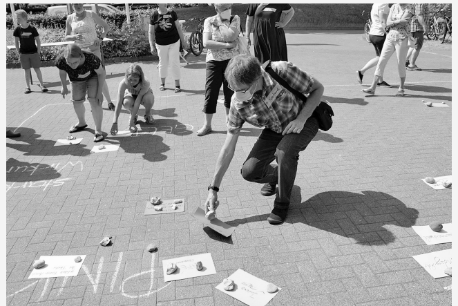
Kokreative Werkstatt in Kosel: Einwohner*innen entwickeln gemeinsam Ideen für ein Kulturfestival, einen Jugendtreff und ein Wandercafé.