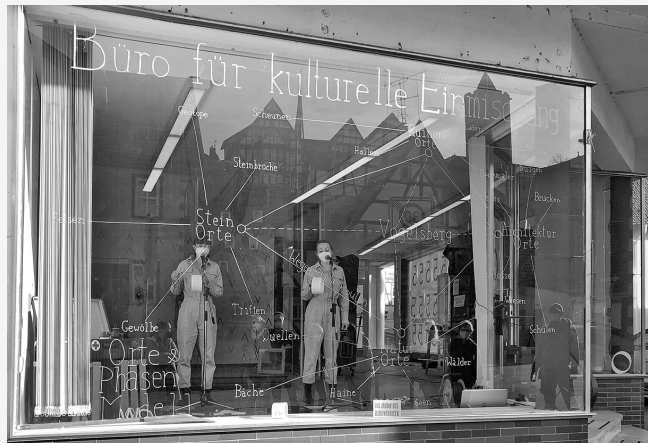
Ein Ort mit Potenzial: Kulturelle Belebung eines leerstehenden Ladenlokals in Schlitz.