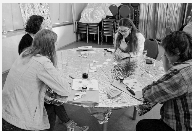
Temporeiches Geschichtenerzählen: Beim TraVospiel sprechen Spielende über Orte im Vogelsberg, die für sie bedeutsam sind.

TRAFO-Region Vogelsbergkreis travogelsberg.podigee.io Podcast zum Spiel: Episode 2