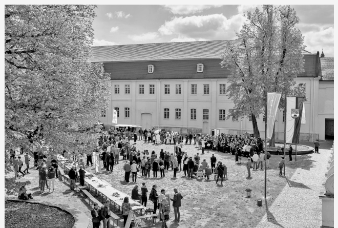
Erfolgreicher Auftakt: Mehr als 1.500 Besucher*innen kamen zum ersten #BLICKWECHSEL im Schloss Köthen.