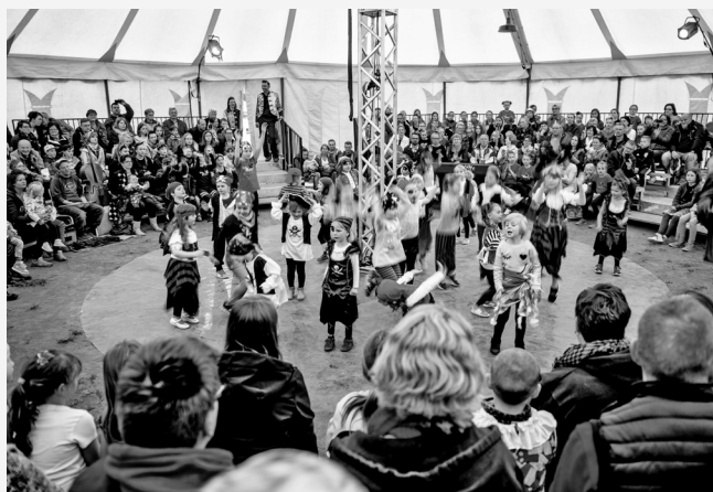
Bühne und Begegnungsort: Das „Reisende Circuszelt“ schafft Raum für Vereine und Initiativen vor Ort.