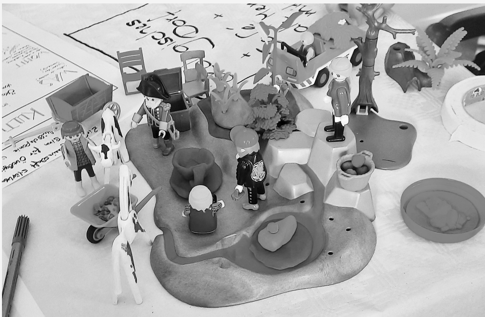
Kokreatives Arbeiten: Mit Playmobil werden Ideen für neue gemeinsame Kulturformate sichtbar gemacht.

TRAFO-Region Rendsburg-Eckernförde www.kreiskultur.org/kokreation/was-ist-kokreation www.kreiskultur.org/mitmachen/was-passiert-wann