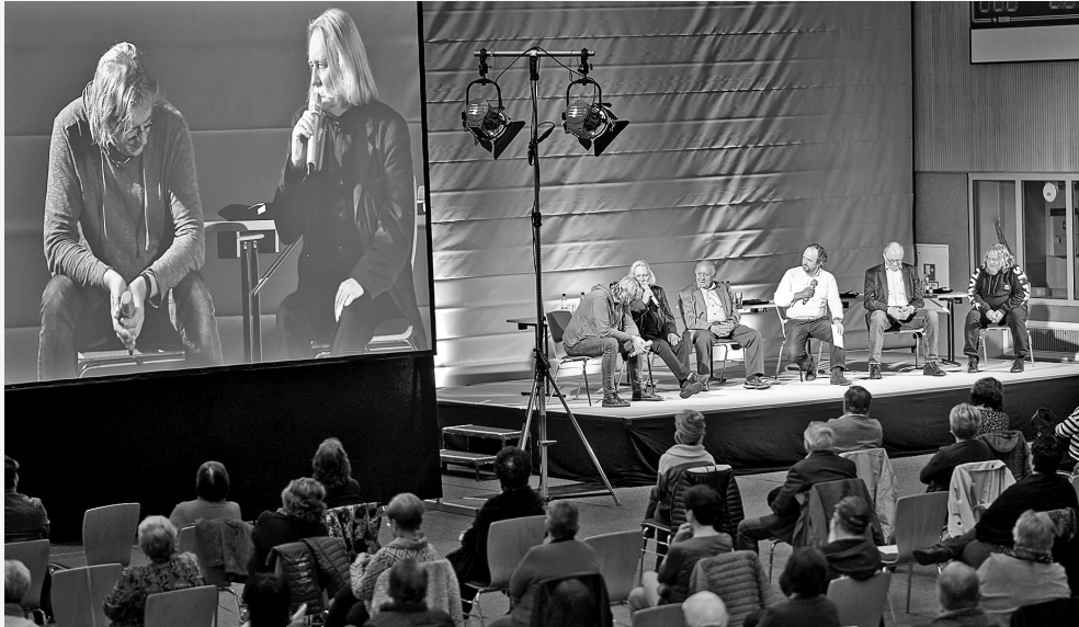
Aufarbeitung lokaler DDR-Kulturgeschichte: Der Zeitzugensalon zum ehemaligen Kulturhaus „Esse“ in Schmölln.