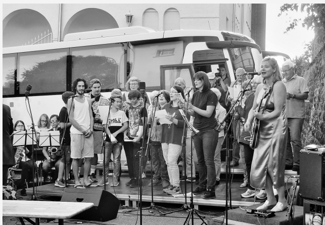
„Vereint euch!“ Die aus Gesprächen mit Engagierten entstandene Hymne wird beim „Festival der Vereine“ gemeinsam aufgeführt.

TRAFÖ-Region Saarpfalz www.kultur-plus.com/ideenwerk/aktuell