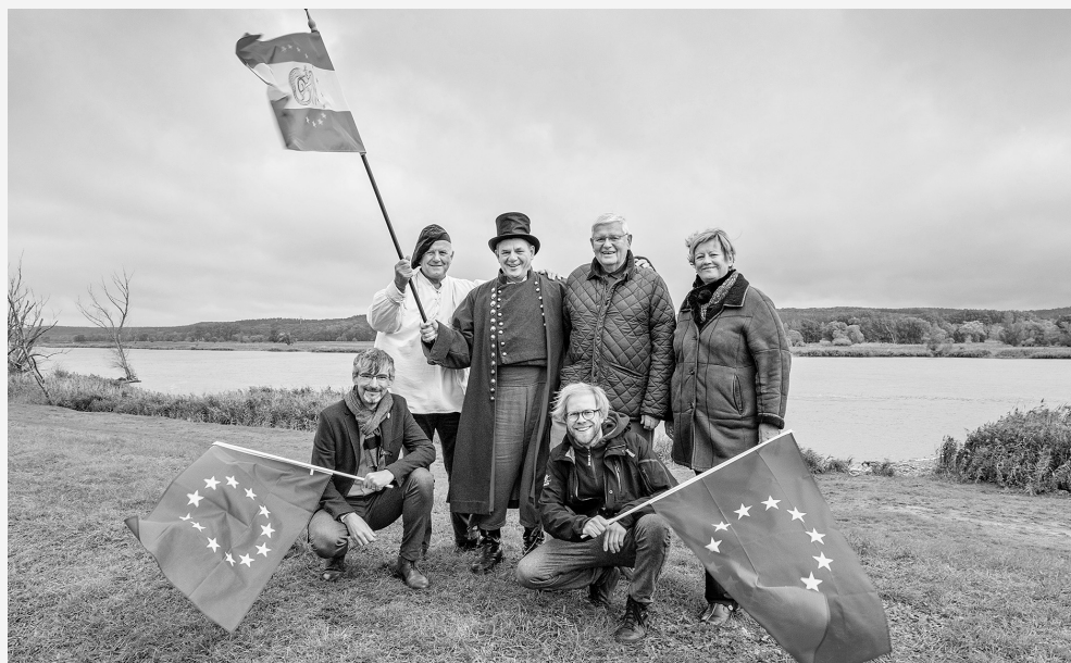
Erfolgreiche Zusammenarbeit: Im Netzwerk Kulturerbe Oderbruch haben sich haupt- und ehrenamtliche Akteur*innen 2020 gemeinsam auf das Europäische Kulturerbe-Siegel beworben.