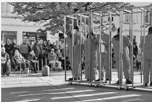
Gefördert in LEADER: Aufführung von „Hierbleiben ... Spuren nach Grafeneck“ des Theater Tonne auf dem Reutlinger Marktplatz.

TRAFÖ-Region Schwäbische Alb www.trafo-programm.de/der-trafo-leader-fonds