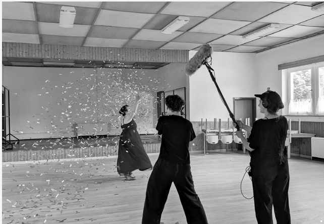
„Das lauteste Dorf“: Videodreh bei der Dorfesidenz in Nieden.