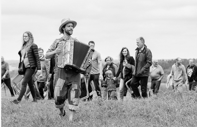
Bürgerbühne auf dem Land: Aufführung des Stücks „Der Schatz von Upflamör“.