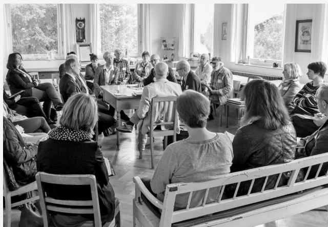
Angeregter Austausch auf der Kulturplattform #2 der Lernenden Kulturregion Schwäbische Alb.

TRAFO-Region Schwäbische Alb www.trafo-programm.de/kulturplattform